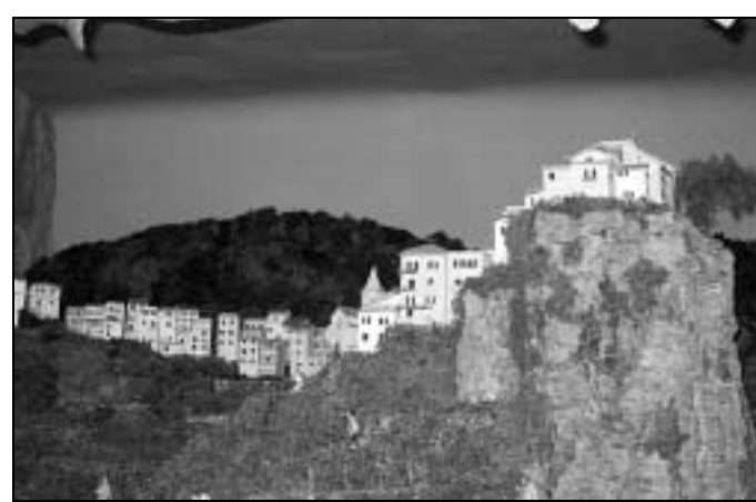
Il presepe che riproduce Corniglia in mostra all'abbazia di Quarto