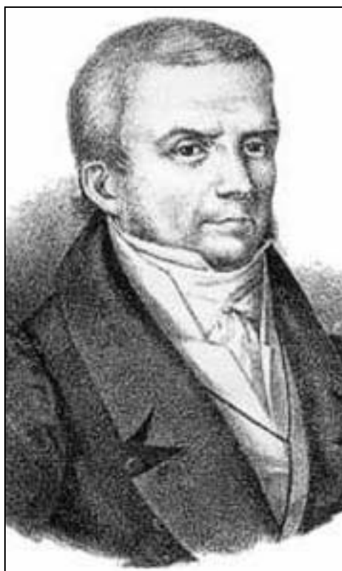
Martin Piaggio uno dei poeti studiati nel corso