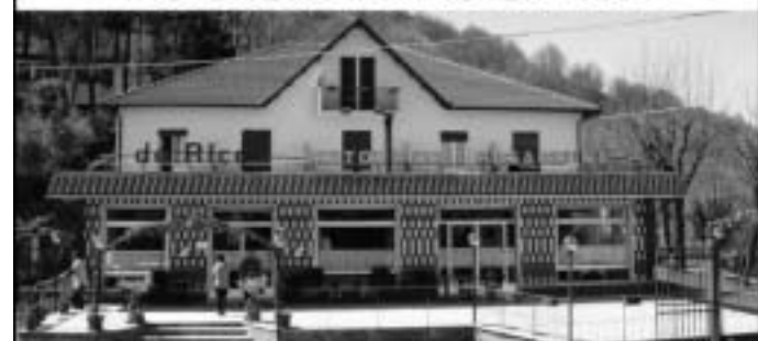
Il Sant'Alberto di Bargagli, 21 metri di Genova, immerso nella collina dell'entroterra, a 300 m di altitudine con una panoramica sull'Agroto.