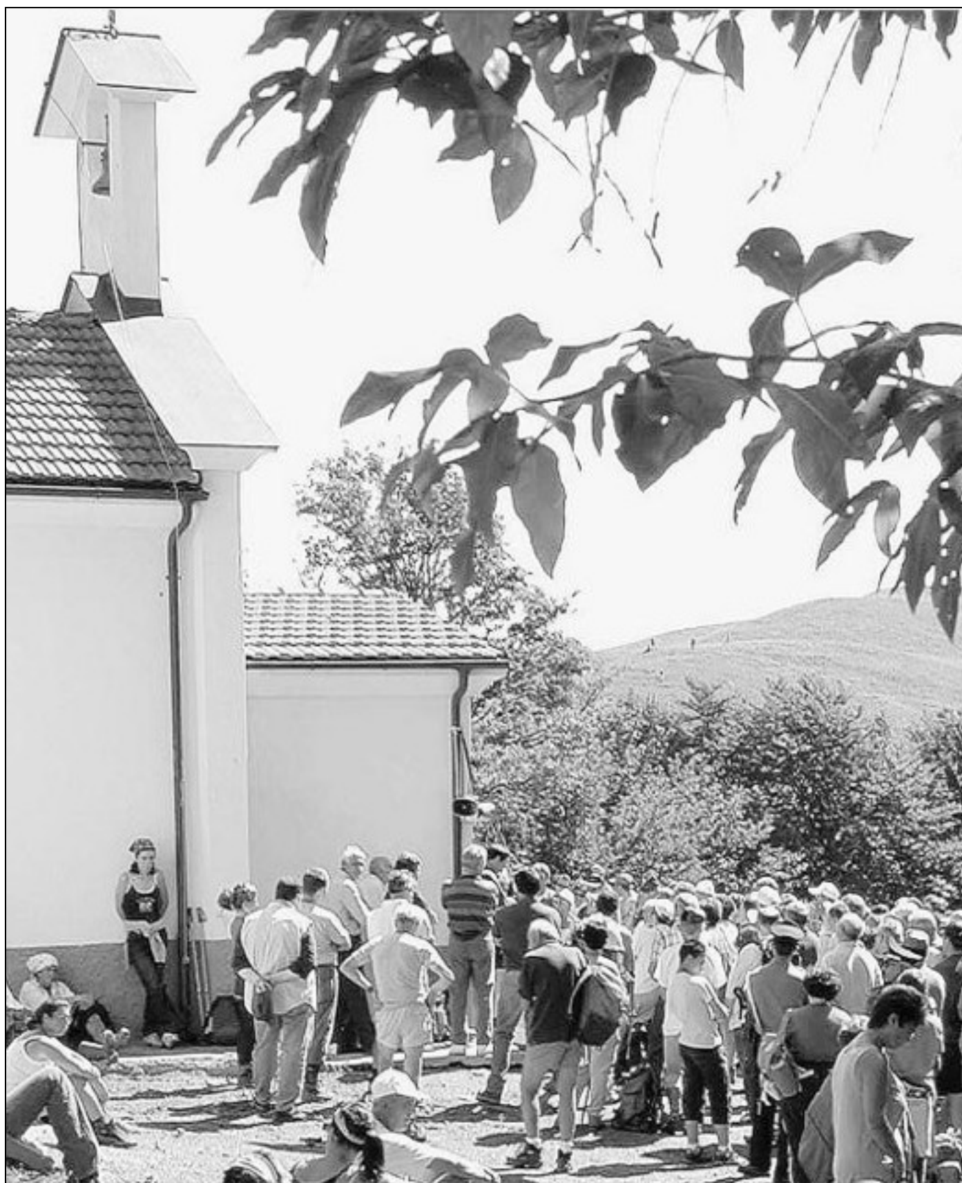
Una sosta alla cappelletta prima di proseguire verso la vetta dell'Antola dove sabato e domenica si svolgerà la tradizionale festa

Nell'ambito delle celebrazioni per il 150° anniversario della nascita di Freud, giornate di studio sul tema "La psicoanalisi a 150 anni dalla nascita del suo fondatore" oggi alle ore 17.15 all'Istituto per le Scienze psicologiche e la psicoterapia sistemica in via A. M. Maragliano 8/5 incontro con Leonardo Ancona sul tema "La psicoanalisi negli ultimi 50 anni".